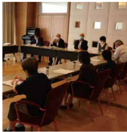
定例運営懇談会の様子

方々からは施設へ対しての要望等をお聞きすることにより、誠実且つ迅速に現場へ反映させるよう努めています。ご入居者の皆さまからは食事に関してのご意見を多く頂き、施設関係者もご要望に対応すべく、様々な検討を行っております。ご入居者の皆さまのお声を直に聴くことのできる、大変貴重な場となっております。