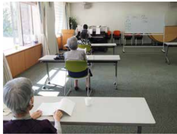
しっかり対策し、趣味を楽しむ

閑静な住宅街にあるグランガーデン福岡浄水。 ちょっと足を延ばせば動物園や植物園も近くにあり、 一年中お散歩が楽しめます。