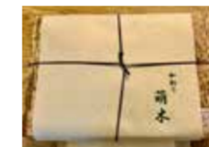
コロナ禍でも食の楽しみを