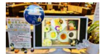
飾りとお食事で十三夜を感じる