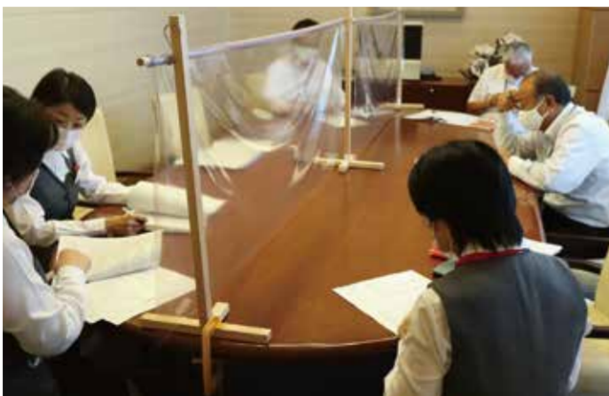
入居審査会の様子

(※但し介護居室の管理費は水道光熱費を含むため増額されます。また、介護保険自己負担分、往診費、薬代、オムツ代等は別途ご負担頂きます。)