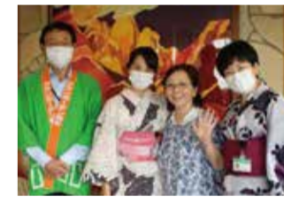
ささやかな夏祭りを楽しむ