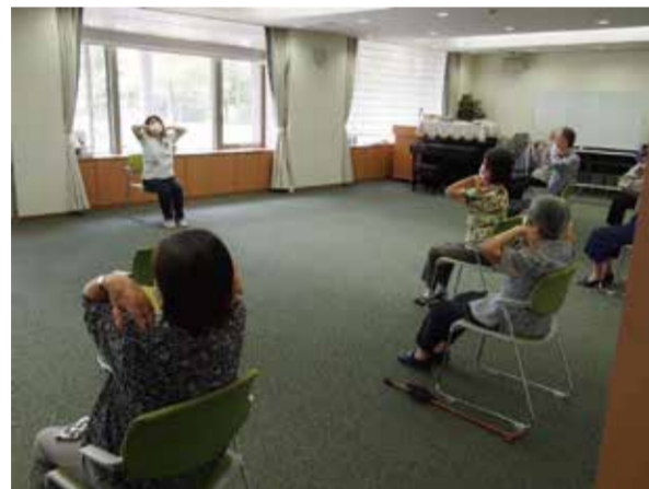
さまざまな動きで健康な体を

グランガーデン福岡浄水では、毎年恒例の作品展を開催いたしました。当館内で行われる、書道、はがき絵サークルの作品や趣味の作品、スタッフの作品も展示いたしました。どの作品も素敵なものばかりで、多くのご入居の皆さまが展示場へ足を運んでくださいました。