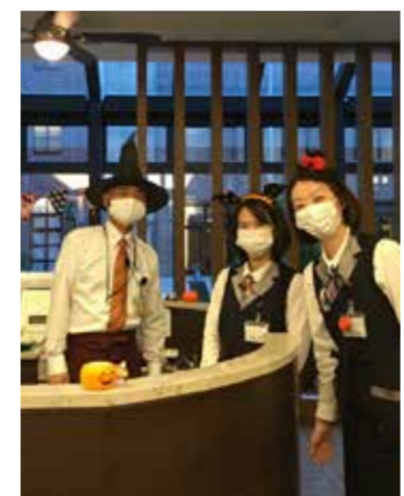
スタッフもハロウィンの衣装でお出迎え

屋外が気持ちの良い季節になってきましたので、ご入居者も朝に夕に庭園の散歩を楽しめます。一周500mある庭園の遊歩道は、毎日新しい花や池の鯉、野鳥との出会いにあふれて、新しい発見に満ちています。 季節を身近に感じられる、まるで公園のような8000坪を越える広大な敷地を持つ「九電ケアタウン」は、皆様のご入居をお待ちしております。