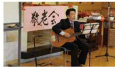
スタッフから感謝と敬愛をお届け

方々からは施設へ対しての要望等をお聞きすることにより、誠実且つ迅速に現場へ反映させるよう努めています。ご入居者の皆さまからは食事に関してのご意見を多く頂き、施設関係者もご要望に対応すべく、様々な検討を行っております。ご入居者の皆さまのお声を直に聴くことのできる、大変貴重な場となっております。