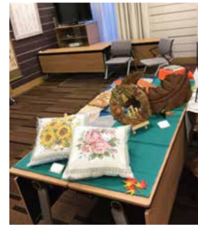
芸術の秋を感じさせる多種多様な作品

九電ケアタウンのサークル「日本抒情歌の集い」では、スタッフによる伴奏に合わせて懐かしい歌を口ずさみ、皆さまにお楽しみいただいています。 歌は、声を出すことにより健康維持とストレス解消もはかることができますといわれています。また、若い頃に歌った歌は、そのころの記憶を鮮明に呼び戻し、認知症の進行を遅らせる効果もあるそうです。 新型コロナウイルス対策のため、人数を制限し、2回に分けて実施しました。適切な距離をあげ、密にならない間隔を保ち、窓を開け換気を良くして、実施しています。